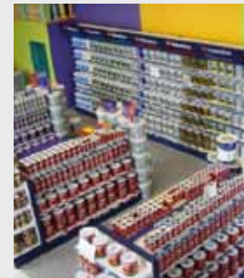
Ferreterías, Tiendas de pintura...