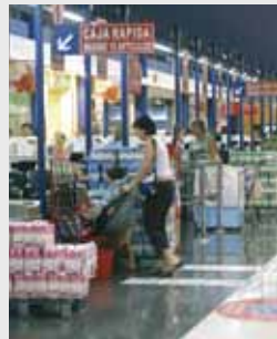
Supermercados, fruterías, carnicerías...